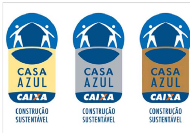
Categorias ouro, prata e bronze

ABNT QUALIDADE AMBIENTAL: este selo não vale apenas p/ materiais da construção civil. O Rótulo Ecológico – Qualidade Ambiental da ABNT segue as normas ABNT NBR ISO 14020:2002 e ABNT NBR ISO 14024:2004, sendo classificado como um selo de Tipo I, ou seja, que leva em consideração a avaliação do ciclo de vida do produto, em todas as etapas do processo: extração de recursos, fabricação, distribuição, utilização do produto e descarte.