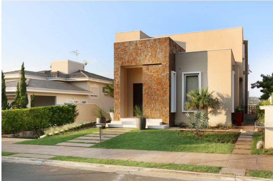
Selo LEED FOR HOMES - casa no condomínio Alphaville - Campinas/SP

A partir de 2014, o selo LEED FOR HOMES certificou a 1ª residência no Brasil, em Campinas/SP (condomínio Alphaville).