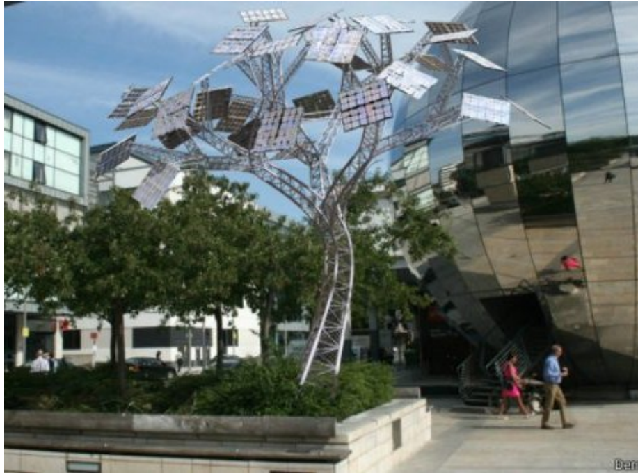
Bristol - cidade da Inglaterra Carregam smartphones