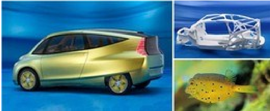
Carro inspirado no peixe-cofre