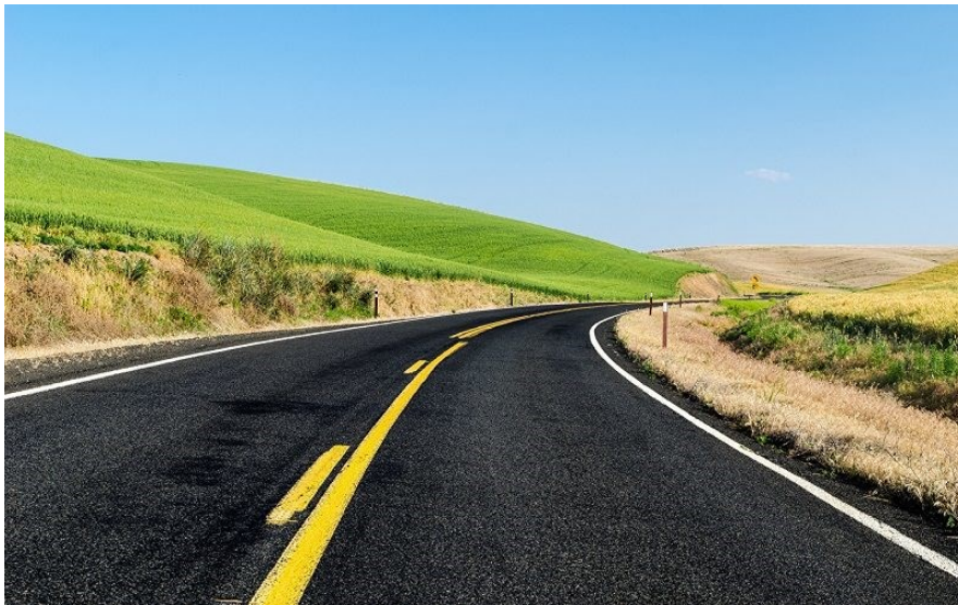
Asfalto que se auto regenera

No contexto da Biomimética, onde as construções e objetos foram planejados de acordo c/ algum tipo de observação da natureza, é bom dizer que, nas empresas, os funcionários produzem mais se o ambiente que trabalham estão mais próximos do meio natural. Por exemplo, quando se coloca plantas, aquários, quadros ou enfeites próximos a mesas, cadeiras, estantes e outros móveis do local.