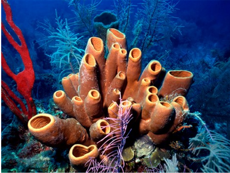
Esponjas do mar