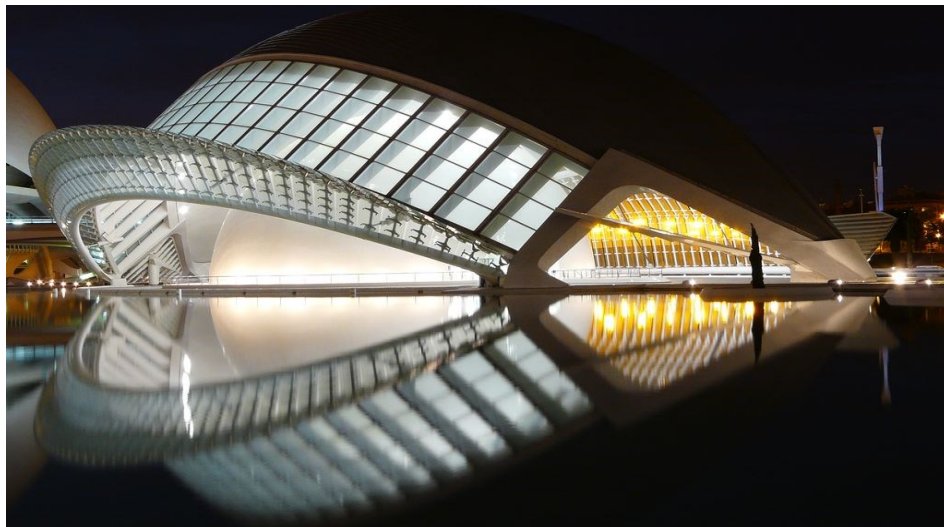
Prédio em forma de peixe

E também, um dos prédios nas Cidades das Artes, em Valência. A edificação, ao ter seu reflexo noturno no espelho d'água, parece um peixe de boca aberta. Neste caso, o arquiteto buscou uma integração ecossistêmica entre a construção e o espelho d' água (analogia peixe – lago).