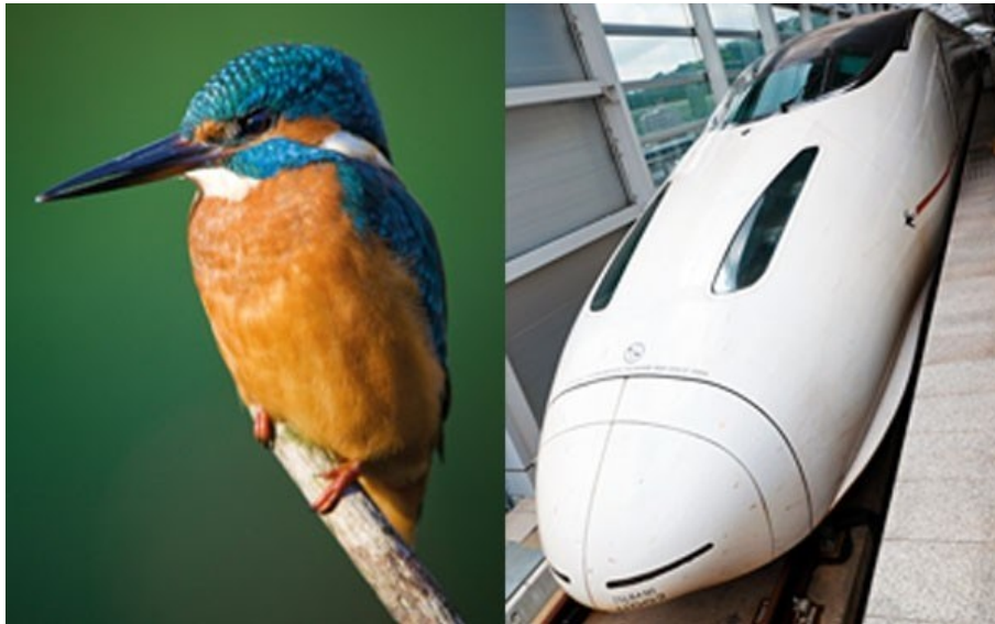
Trem bala inspirado no pássaro

Este é o trem bala no Japão, que teve o desenho de seu nariz inspirado no pássaro martim-pescador, p/ sanar o problema do alto barulho que produzia ao entrar em túneis com alta velocidade. Este pássaro precisa mergulhar para se alimentar, trocando rapidamente de um ambiente de baixa resistência – o ar - para um com muita resistência – a água. Esta ave possui a aerodinâmica perfeita para essa situação, copiada pelo trem bala.