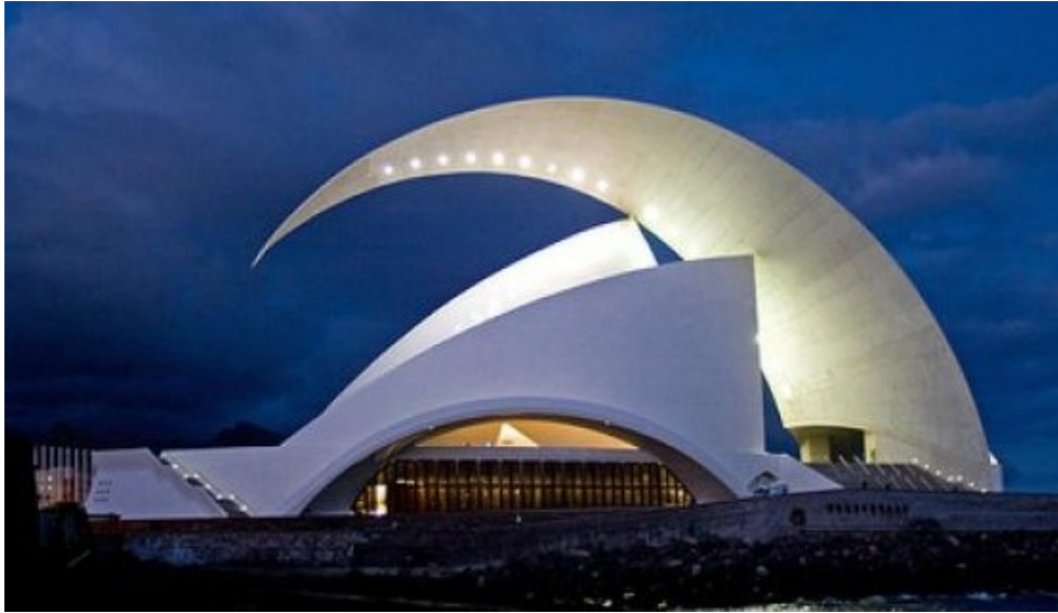
Auditório - referência à lua

O arquiteto espanhol, Santiago Calatrava, projetou 2 prédios na Espanha baseados na biomimética: um Auditório em Santa Cruz de Tenerife, cujo desenho faz referência à lua minguante. O teto curvado favorece a boa acústica do local, aspecto de funcionalidade projetual.