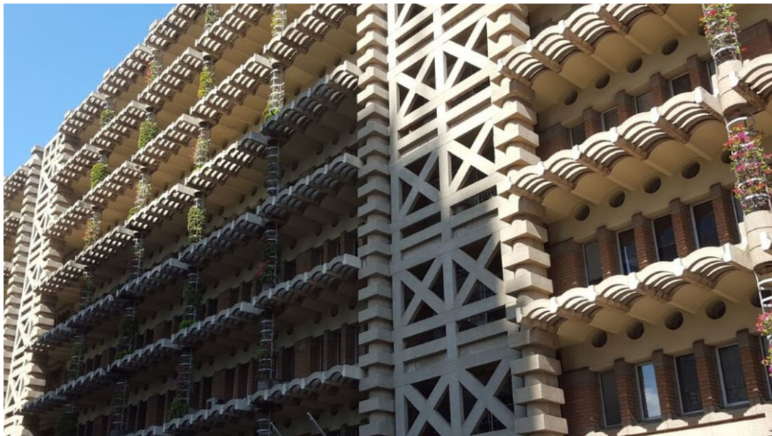
Fachadas - Complexo Eastgate