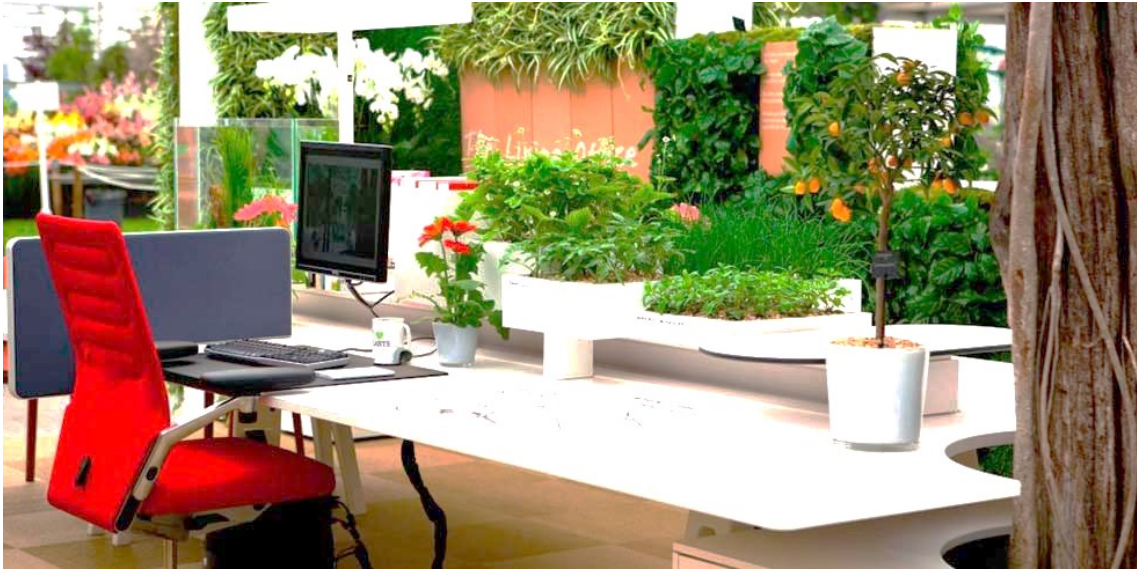
Ambiente agradável e produtivo

A melhora na qualidade do ar, associada aos efeitos psicológico e energético, originados pelas cores, formas e aromas (um dos tópicos do Informativo anterior), faz com que os funcionários se sintam mais à vontade em seus locais de trabalho, e conseqüentemente, aumentem seus níveis de concentração e inspiração.