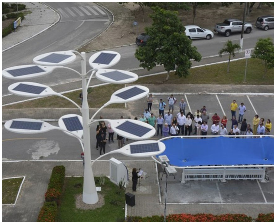
Placas Fotovoltaicas - Árvore Solar - Universidade Estadual do Ceará Carregam bicicletas elétricas