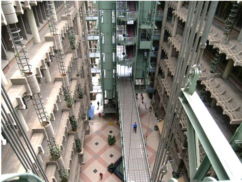
Interior do Edifício - permeabilidade estrutural

A "pele" da torre se aquece com o ar externo durante o dia e absorve o calor em sua estrutura. Ao chegar no meio do prédio, o ar já está mais frio. À noite, o calor que foi absorvido durante o dia aquece o interior, criando condições mais confortáveis para as pessoas que vivem e trabalham no local.